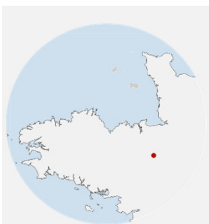
Saint Grégoire (35)

Maître d'ouvrage : Ville de Saint Grégoire