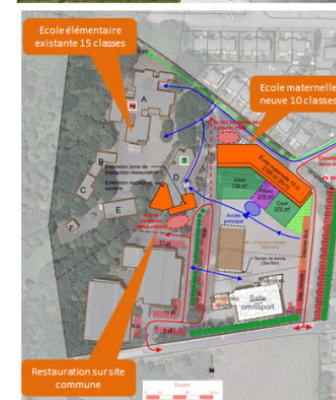
Extraits rapports scénarios