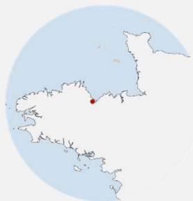
St Brieuc (22)

Maître d'ouvrage : Terre et Baie Habitat