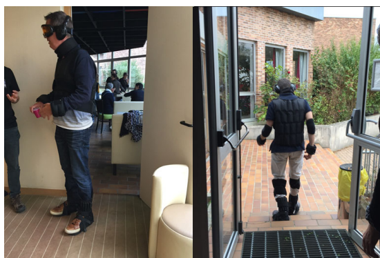
Mise en situation