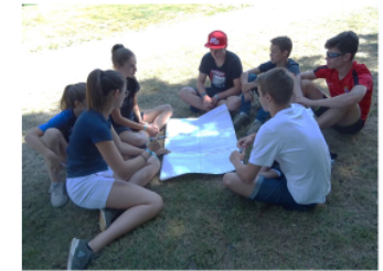
+ Distribution de flyers pour emmettre les idées