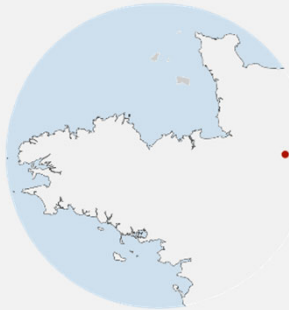
Lassay les Châteaux (53)