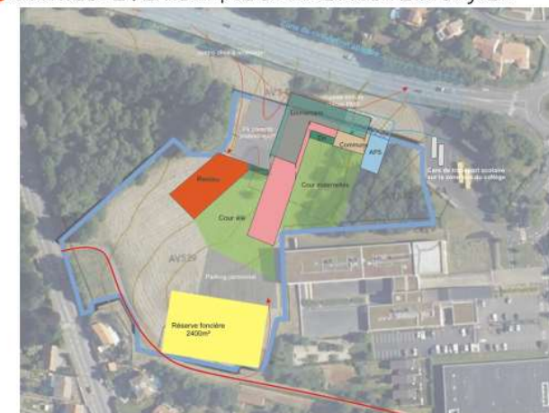
CÉRUR_ Programmation d'un groupe scolaire 20 classes à Vertou - COPIL 1 - 31 mars 2021 (m) groupe reflex_